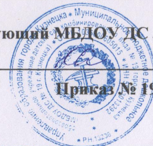
График повышения квалификации педагогов МБДОУ ДС № 19 г. Кузнецка